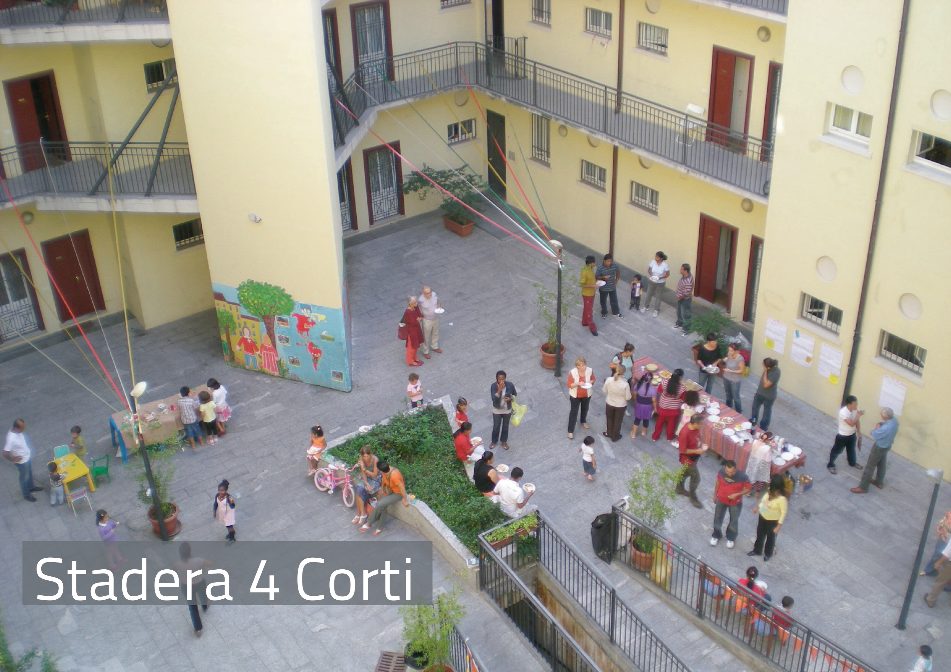
Stadera 4 Corti